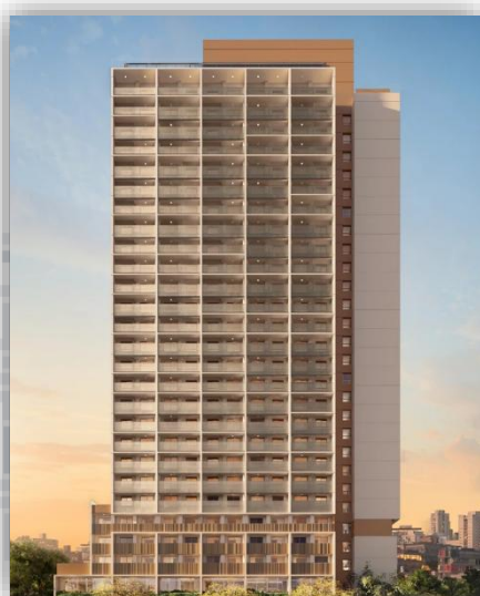
*Perspectiva em 3D da Fachada.

Para obter mais detalhes, acesse o link .