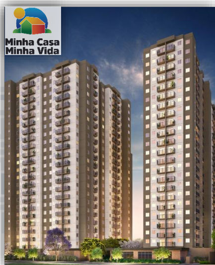
*Perspectiva em 3D da Fachada.

Para obter mais detalhes, acesse o link .