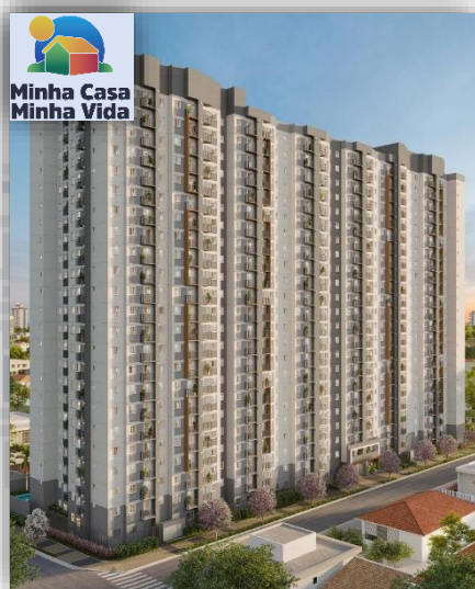
*Perspectiva em 3D da Fachada.